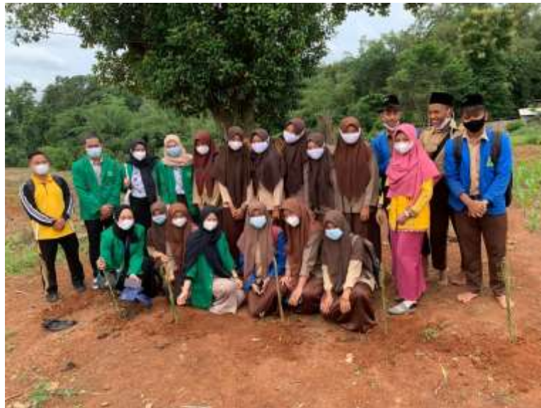
Gambar 2.3 Foto kegiatan PKM