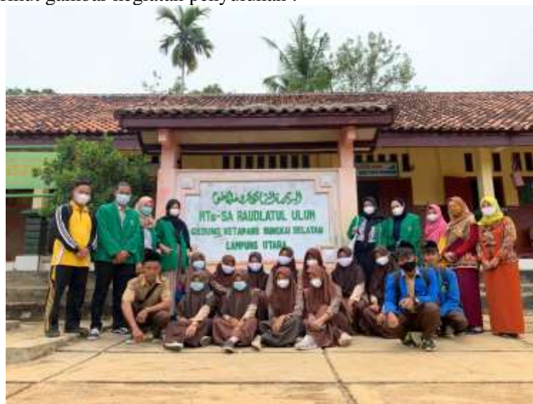
Gambar 2.2 Foto kegiatan PKM