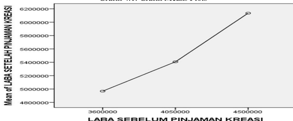
Grafik 4.1. Grafik Means Plots

Grafik tersebut menunjukkan adanya peningkatan pendapatan atau laba setelah melakukan pinjaman dibandingkan dengan sebelum melakukan pinjaman. Grafik diatas menunjukkan adanya trend linear yang bersifat positif.