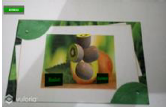
Gambar 4. Uji Coba Program

Gambar 4 merupakan hasil uji coba program pengenalan buah pada anak usia dini dengan teknologi augmented reality. Yang mana objek 3d dimensi dari buah kiwi di ditampilkan pada layar monitor dengan kamera yang disorotkan pada buku pengenalan rumah adat sumatera.