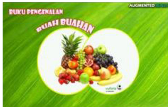
Gambar 3. Tampilan Menu Utama dan Menu Bantuan

Proses pembuatan aplikasi buah ini dibuat dengan menggunakan software microsoft visual basic 6.0. untuk pembuatan tampilan program nya, sedangkan untuk pembuatan objek 3d nya menggunakan 3DStudio Max. Gambar 3 merupakan tampilan menu utam dan menu bantuan user .