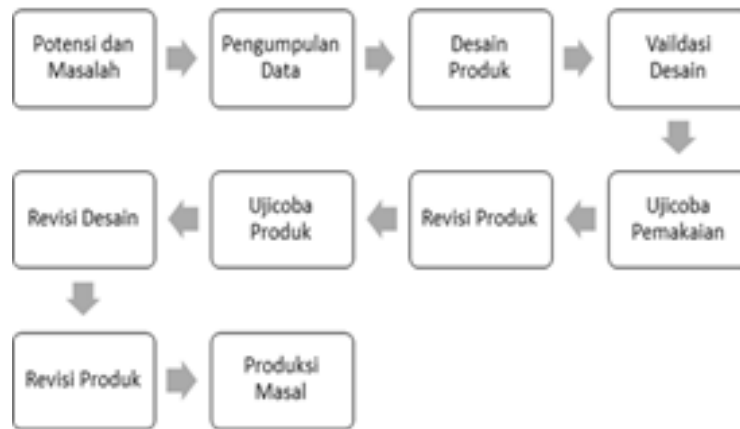
Gambar 2. Metode Research and Development